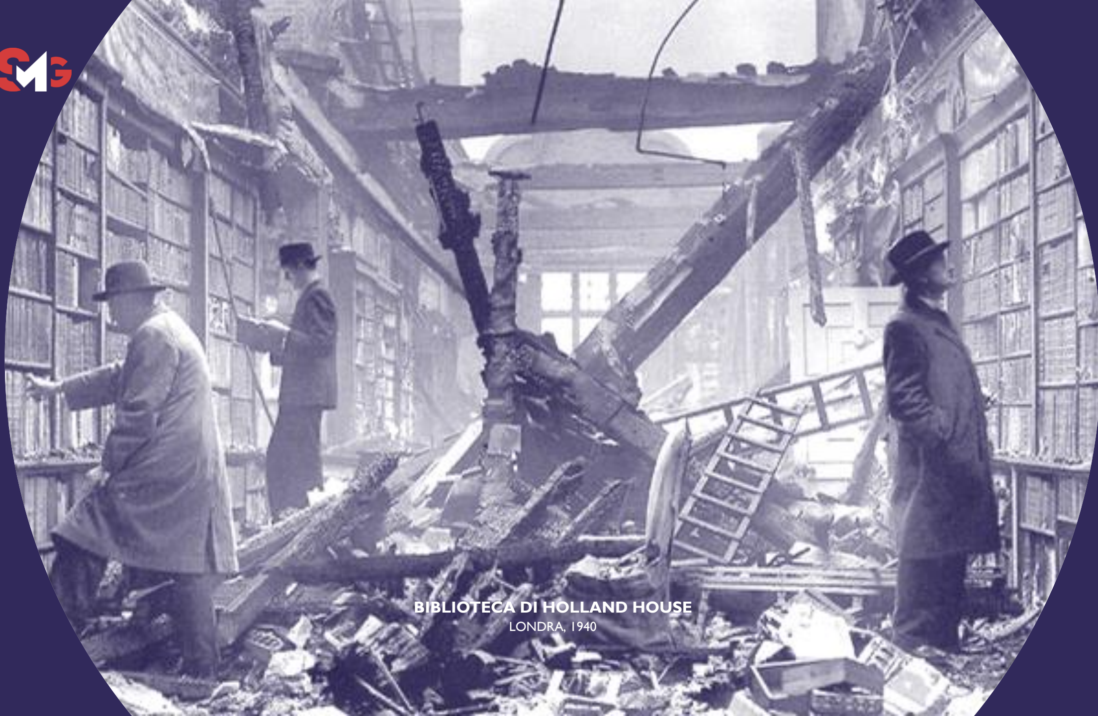
BIBLIOTECA DI HOLLAND HOUSE LONDRA, 1940