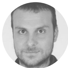
Francesco Fiaschini Autore